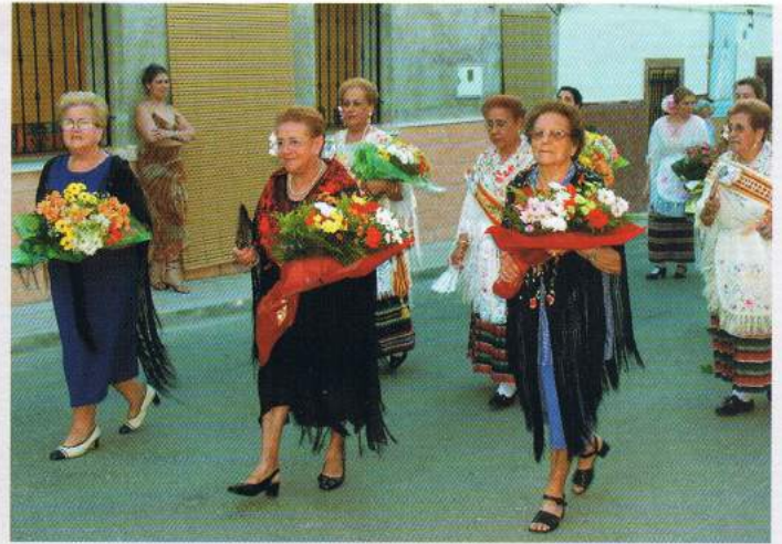
▲ Numerosos colectivos como el de la Asociación "11 de Septiembre" no faltaron a la cita anual de la Ofrenda.