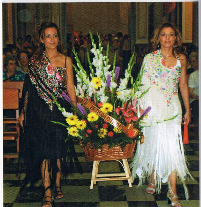
▲ Algunas barracas como "Trocolotroc" tomaron parte, como viene siendo costumbre, en la Ofrenda de flores a la Virgen del Remedio.