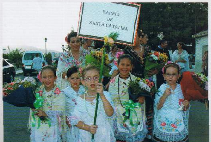
▲ El Barrio de Santa Catalina contó con una nutrida representación.