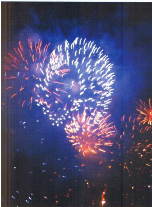
▲ Como es habitual, y para dar comienzo a la Feria y Fiestas, el público pudo observar, en el cielo pinosero, el primero de los castillos de fuegos artificiales que abrió, junto al resto de actos, la Feria y Fiestas 2004.