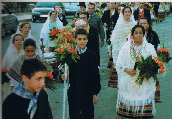
▲ Otro de los colectivos participantes fue el "Grup de Danses del Pinós".