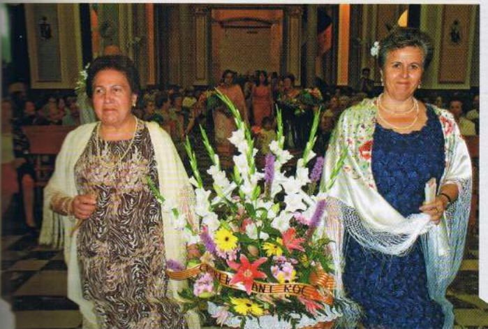
◀ Dos vecinas de "Sant Roc" portaban una bonita cesta que entregaron como ofrenda del barrio.