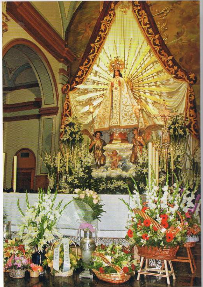
▲ Poco a poco el Altar Mayor se iba cubriendo de hermosos ramos de flores que vecinos y colectivos del municipio iban dejando para honrar a la patrona de todos los pinoseros.