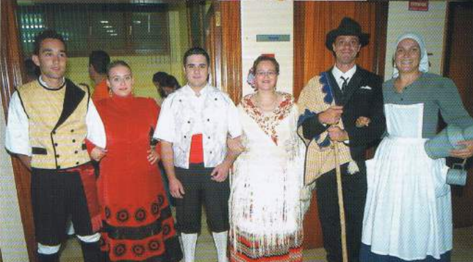
▲ Tres parejas, con sus correspondientes trajes típicos, en representación de los grupos que tomaron parte en el Festival de Folclore "Villa de Pinoso": Asociación Cultural "Falcatrúerios" de Lugo, Asociación Cultural "Villa Real de San Antonio" de Portugal y los anfitriones, el Grupo Coros y Danzas "Monte de Sal".