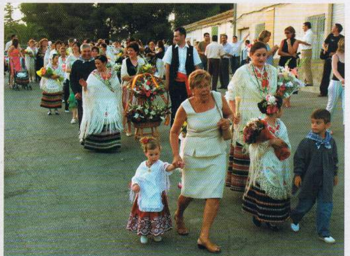
▲ Niños, colectivos, asociaciones y entidades locales acuden a la Ofrenda de flores, todos ellos representan a la sociedad pinosera y demuestran la gran devoción a la Patrona de Pinoso.