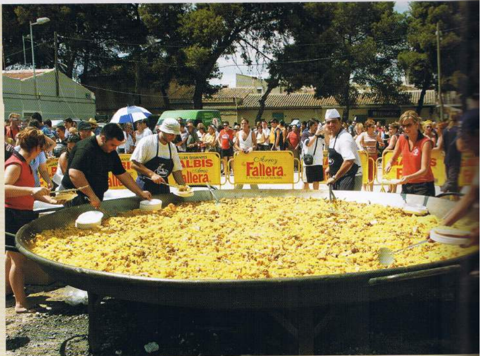
▲ Impresiona la rapidez con la que los cocineros y ayudantes elaboraron este año la paella valenciana. Justo después de su confección miembros de la Comisión de Fiestas y cocineros comenzaron a servir las raciones.

Tras el disparo de una mascletá se iniciaba el reparto de raciones, que fueron degustadas cómodamente, gracias a que el tiempo acompañó con pequeñas ráfagas de aire y nubes que, de vez en cuando, propiciaban pequeñas sombras, que todos los presentes agradecieron.