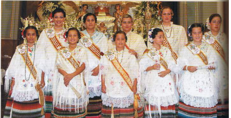
▲ La Corte Infantil y Mayor posó ante el Altar Mayor el primer día de Feria y Fiestas antes de dirigirse a la inauguración del recinto ferial.