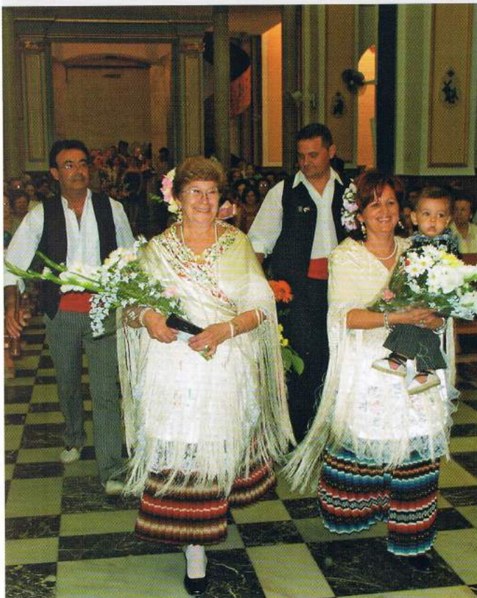
▲ Representantes de la Agrupación "Monte de la Sal" a su entrada al Templo Parroquial mostrando su alegría antes de realizar su ofrenda.